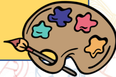
ILUSTRACIÓN 5TO BASICO A 4 MEDIO MARTES 16:00-17:30 SALA 8ªA